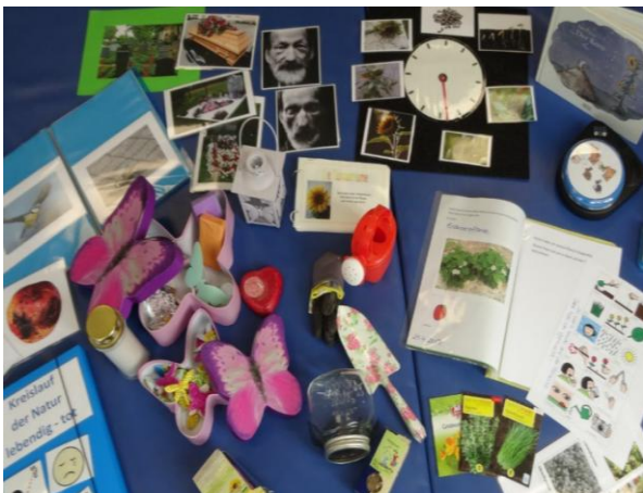
Kreislauf des Lebens