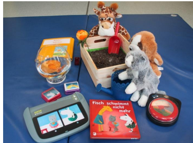
Bilderbücher mit allen Sinnen